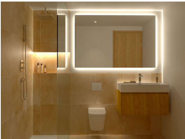
Baño con ducha