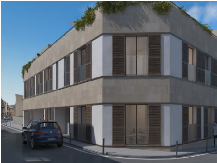
Planta baja en Palma