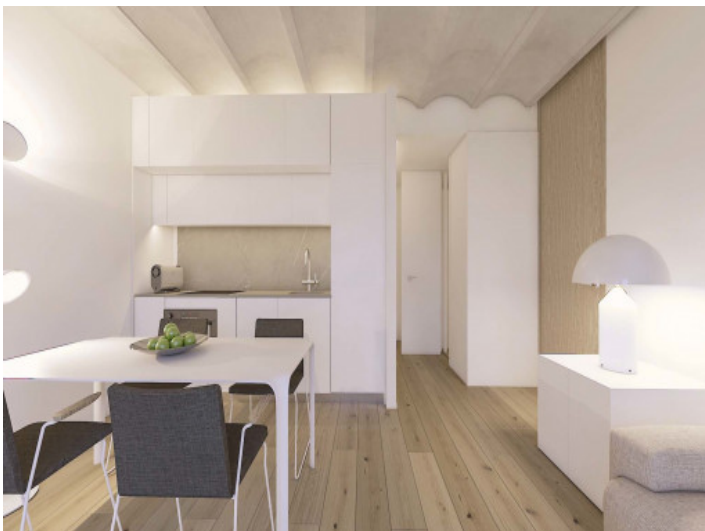
Comedor y cocina