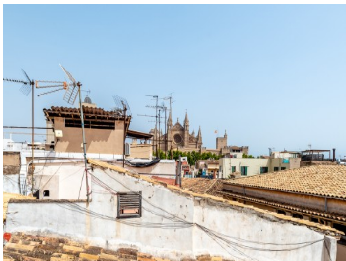
Vistas a la catedral

Toda la información como mejor se puede saber, salvo por error durante el periodo de venta. Sirva este documento como un informe previo, las bases legales solo serán válidas a través de un contrato de compra acordado ante Notario.