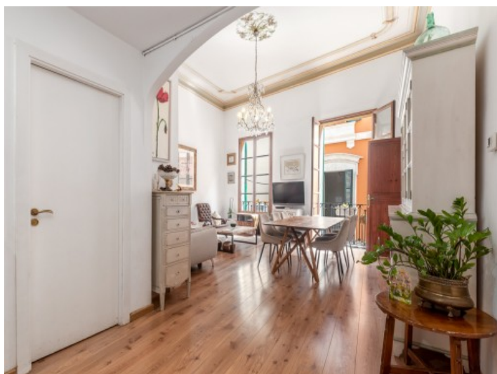
Entrada y salón