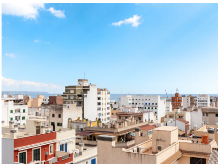
Vistas hasta el mar