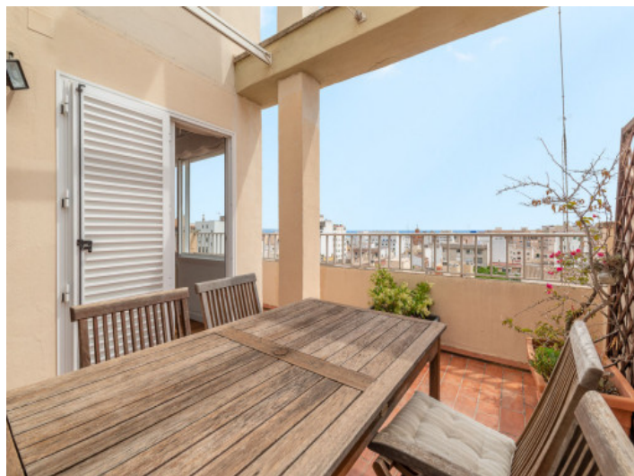
Terraza con vistas al mar