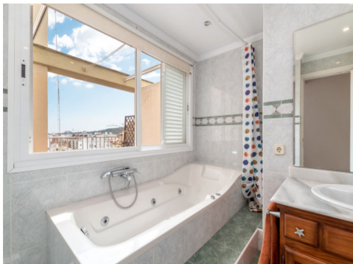
Uno de 2 baños