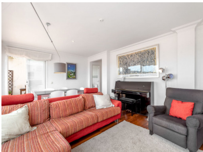
Salón-comedor con acceso a la terraza