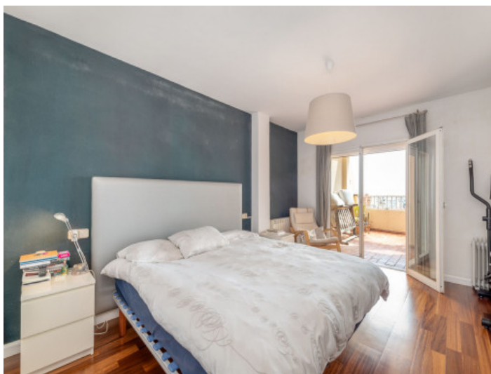
Dormitorio doble con terraza

Toda la información como mejor se puede saber, salvo por error durante el periodo de venta. Sirva este documento como un informe previo, las bases legales solo serán válidas a través de un contrato de compra acordado ante Notario.