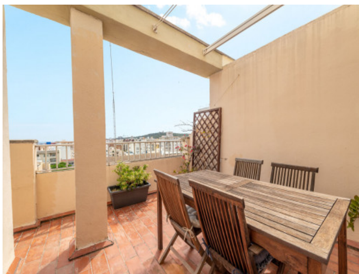
Comedor en la terraza