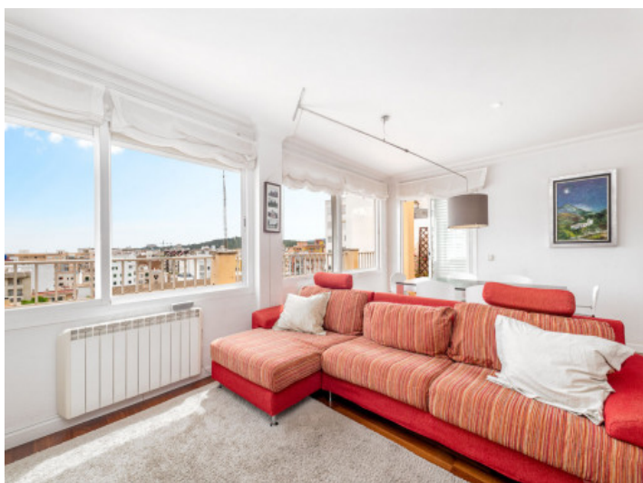
Salón inundado por luz natural