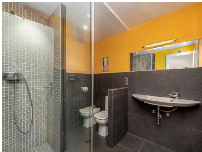
Uno de 2 baños