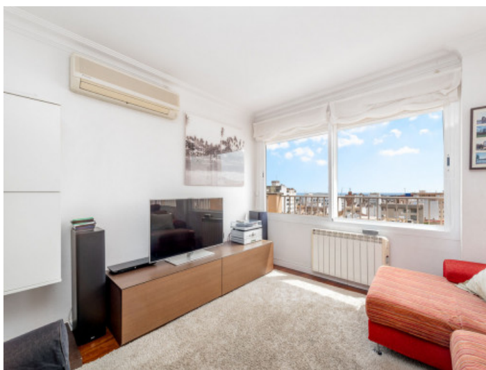
Otra vista del salón