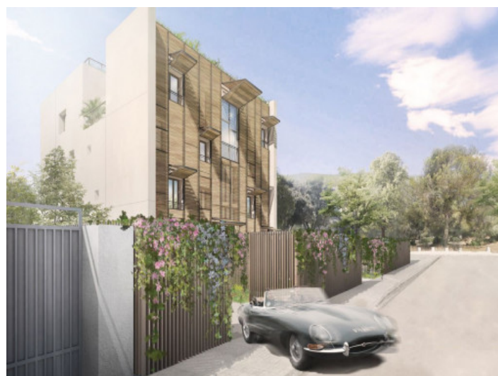
Vista exterior desde la calle

Toda la información como mejor se puede saber, salvo por error durante el periodo de venta. Sirva este documento como un informe previo, las bases legales solo serán válidas a través de un contrato de compra acordado ante Notario.