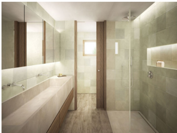
Baño en suite noble con ducha a nivel del suelo