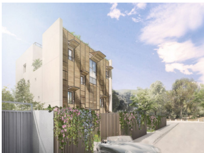
Vista exterior desde la calle