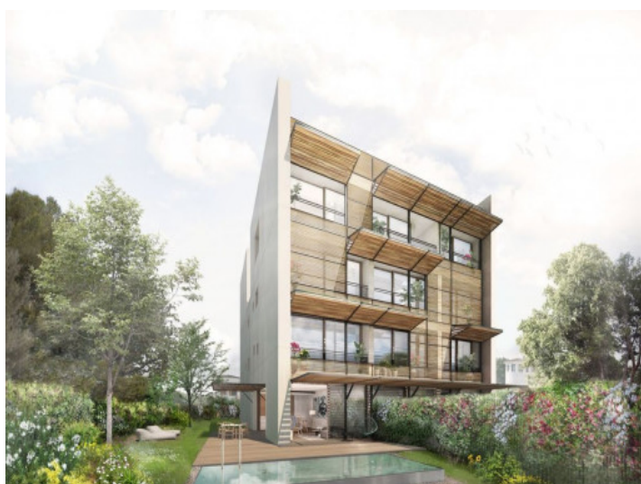
Vista exterior del complejo