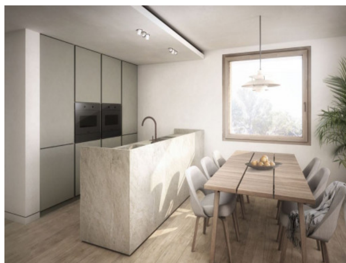
Cocina totalmente equipada con isla central