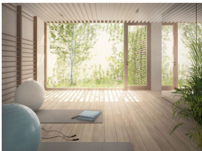
Zona de fitness climatizada