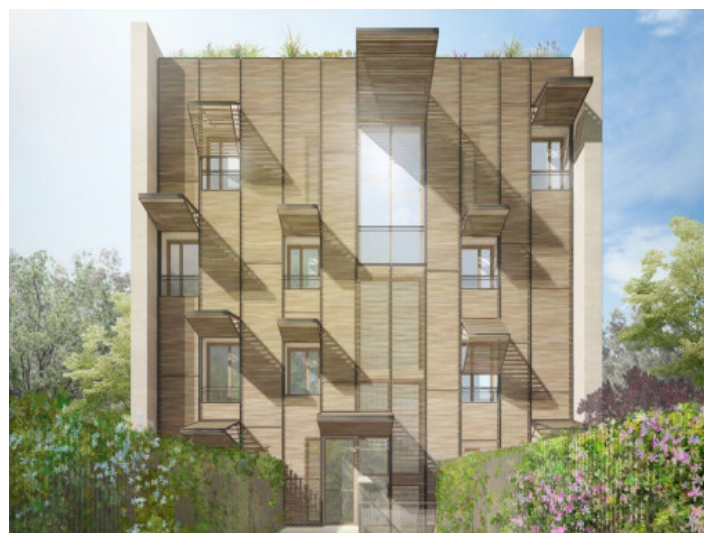
Vista exterior del complejo