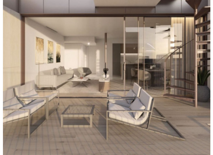
Terraza con zona de estar