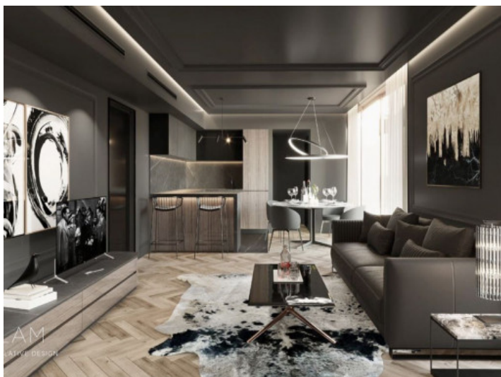
Salón-comedor - Glam