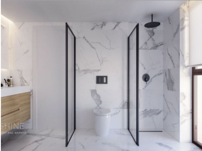
Baño - Shine