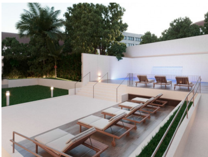
Zona de la piscina atractiva