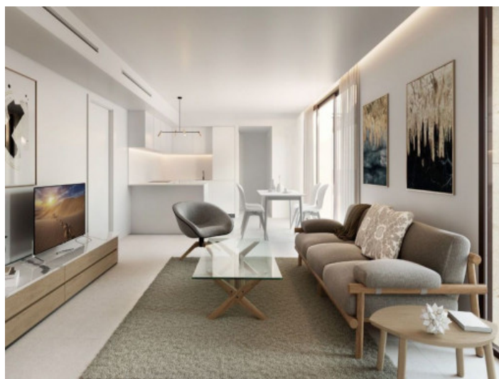
Salón-comedor - Light