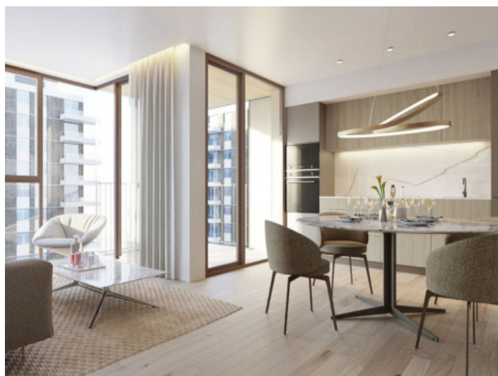
Cocina totalmente equipada