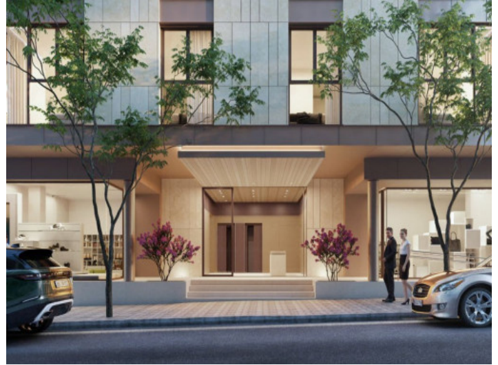
Área de entrada

Toda la información como mejor se puede saber, salvo por error durante el periodo de venta. Sirva este documento como un informe previo, las bases legales solo serán válidas a través de un contrato de compra acordado ante Notario.