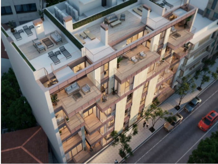
Vista exterior del complejo