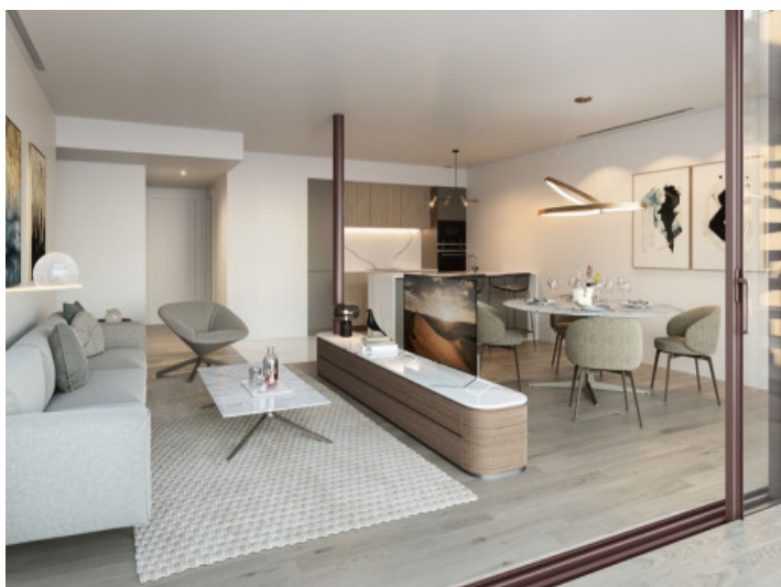
Vista al salón luminoso