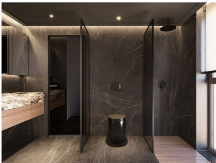
Baño de lujo