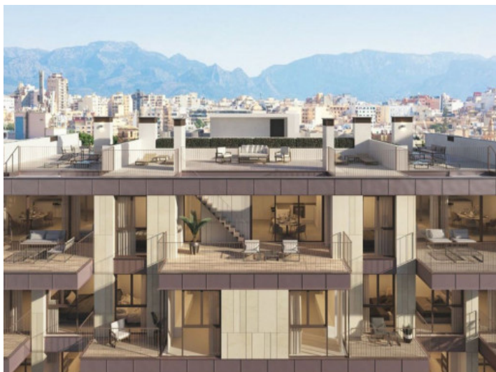
Vista exterior del complejo