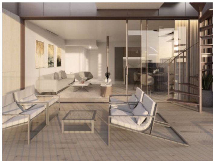
Terraza con zona de estar

Toda la información como mejor se puede saber, salvo por error durante el periodo de venta. Sirva este documento como un informe previo, las bases legales solo serán válidas a través de un contrato de compra acordado ante Notario.