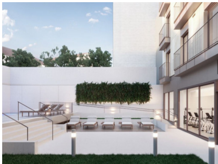
Terraza, piscina y gimnasio