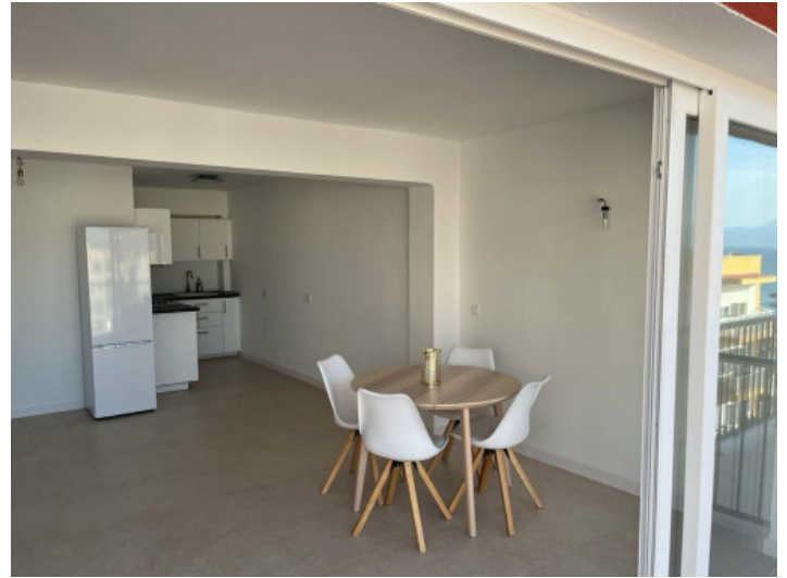
Comedor y cocina