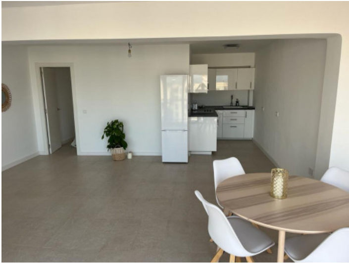
Comedor y cocina