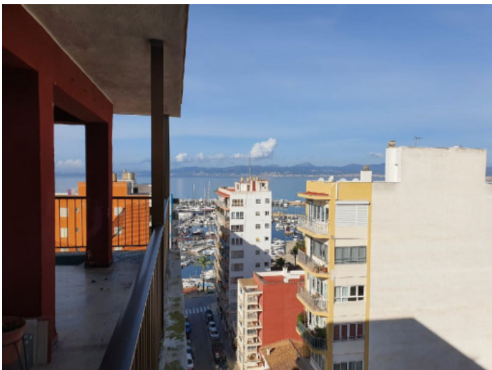
Vistas al mar