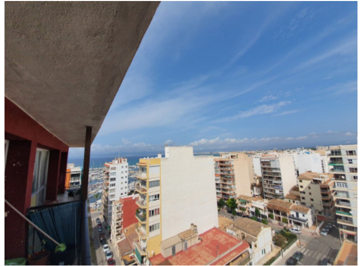
Vistas al mar