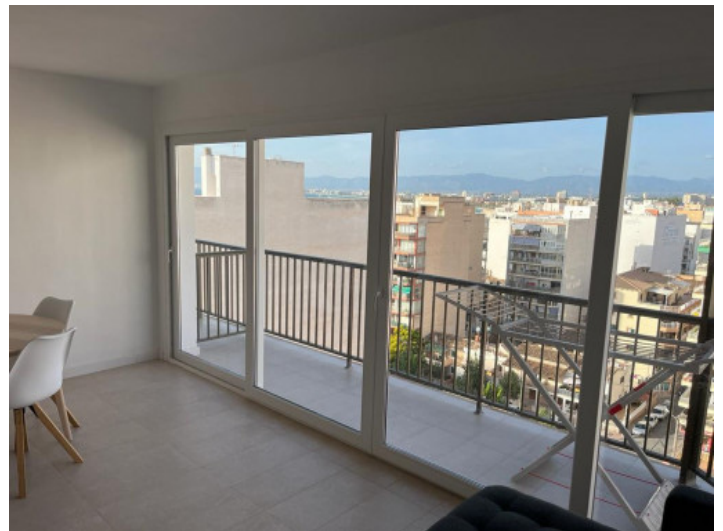
Salón y balcón