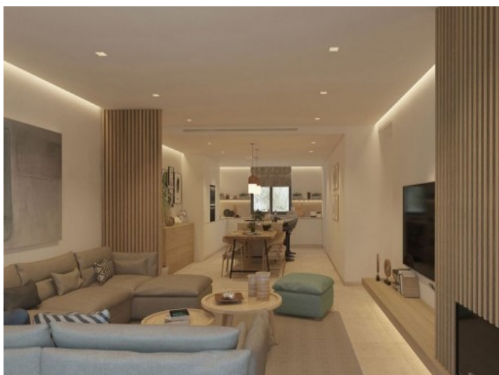
Salón acogedor y abierto