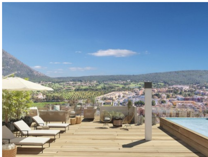
Zona de la piscina soleada