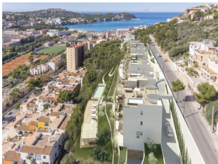
Vistas impresionantes al mar

Toda la información como mejor se puede saber, salvo por error durante el periodo de venta. Sirva este documento como un informe previo, las bases legales solo serán válidas a través de un contrato de compra acordado ante Notario.