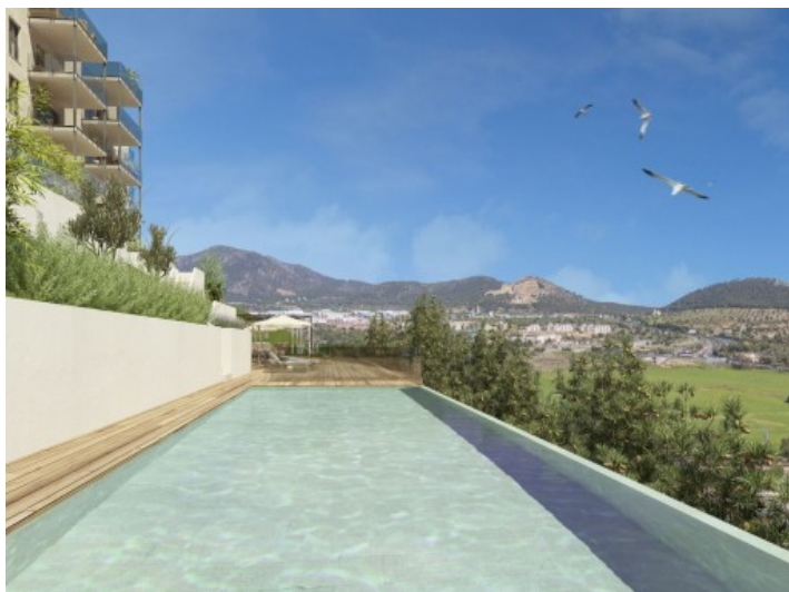
Vista a la piscina comunitaria