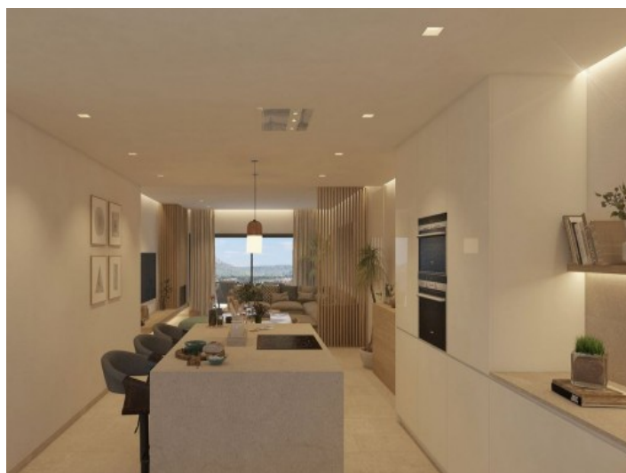
Cocina con isla central