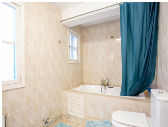
Baño con bañera

Toda la información como mejor se puede saber, salvo por error durante el periodo de venta. Sirva este documento como un informe previo, las bases legales solo serán válidas a través de un contrato de compra acordado ante Notario.