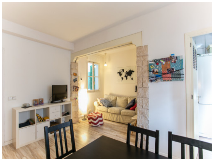
Vistas al salón agradable