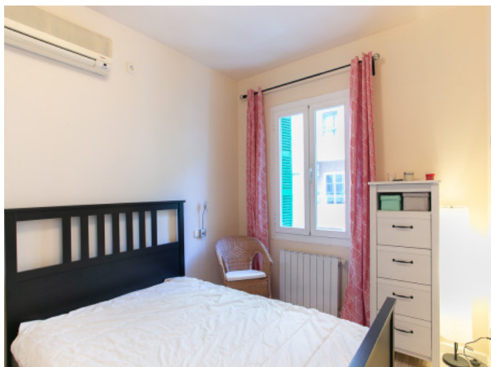
Uno de 2 dormitorios