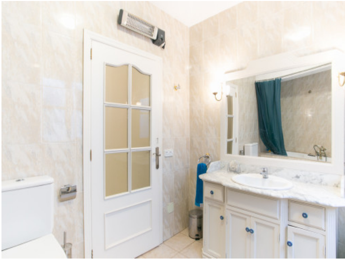
Otra vista del baño