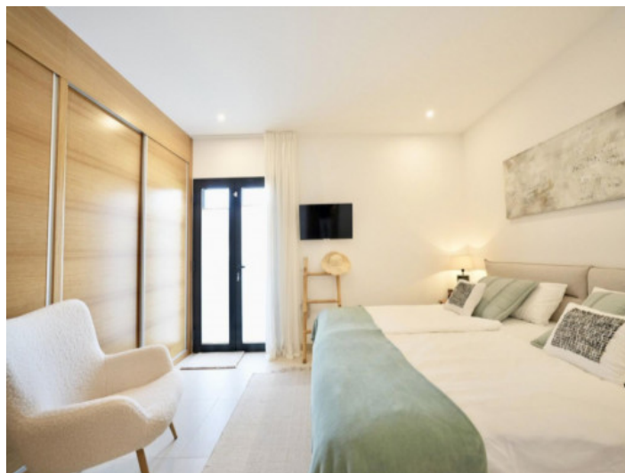
Uno de 2 dormitorios