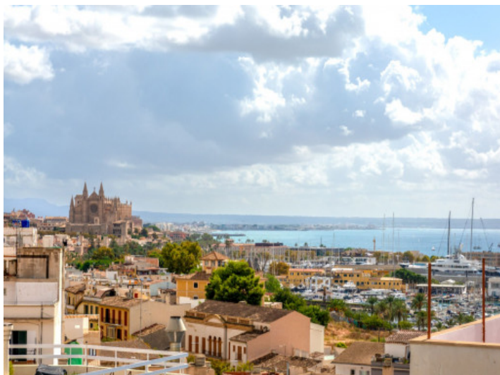
Vistas desde la terraza