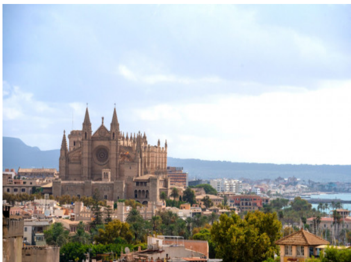
Vistas hasta la cathedral