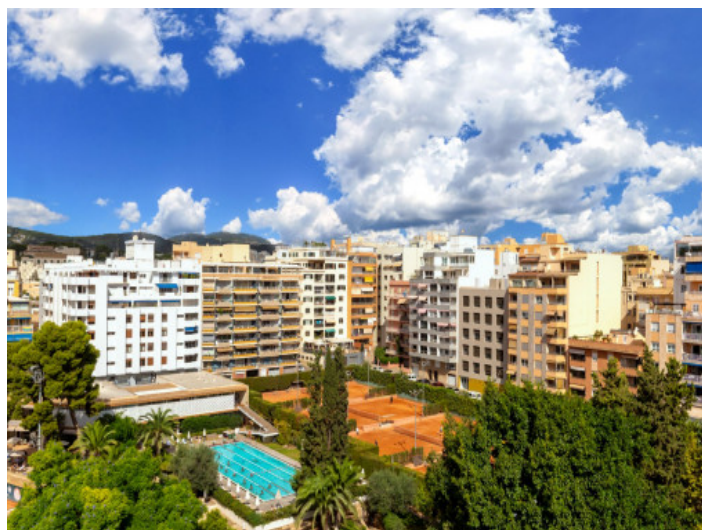
Muy bien situado

Toda la información como mejor se puede saber, salvo por error durante el periodo de venta. Sirva este documento como un informe previo, las bases legales solo serán validas a traves de un contrato de compra acordado ante Notario.