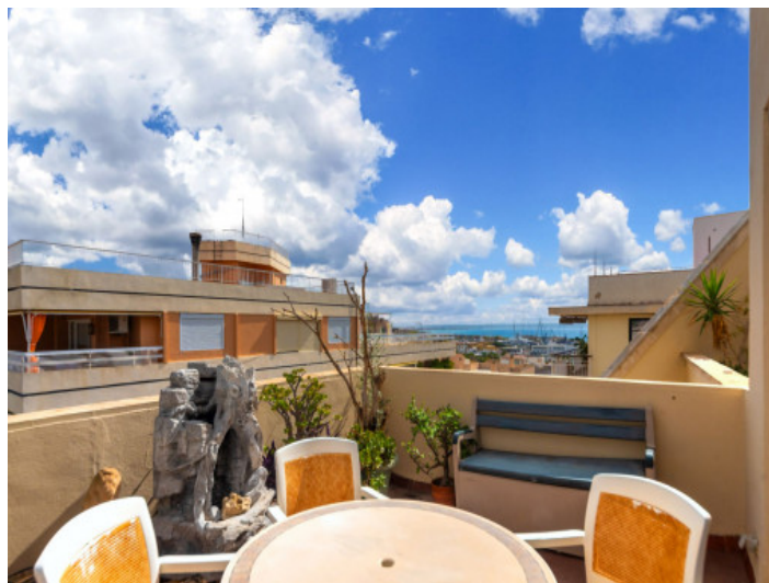
Muy buena ubicación y con parking