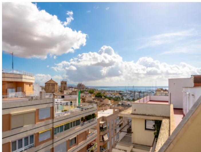
Vistas hasta el mar