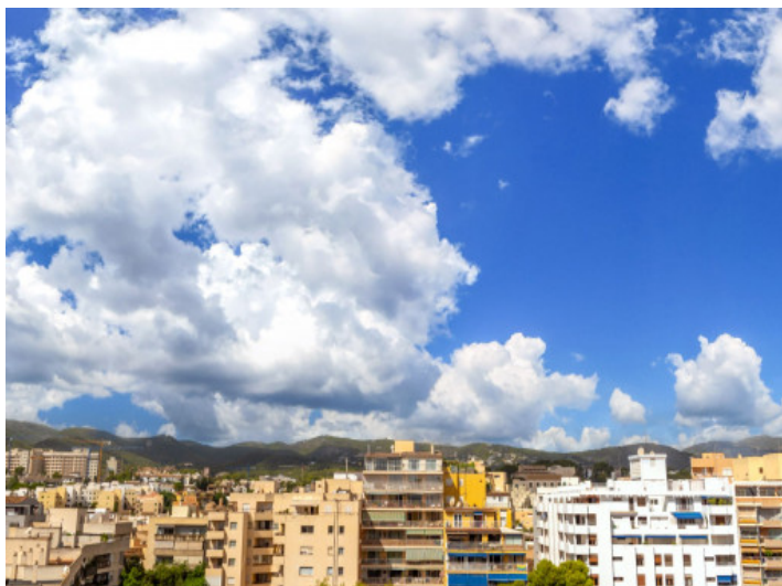
Vistas a la ciudad