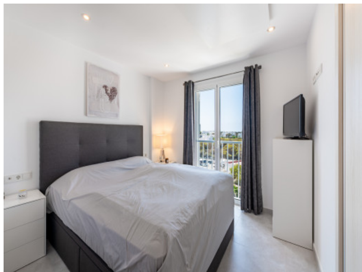
Uno de 2 dormitorios