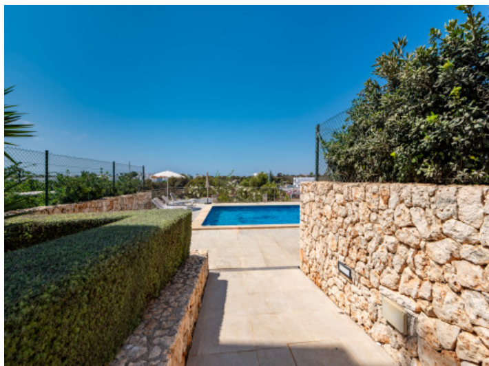
Acceso a la piscina