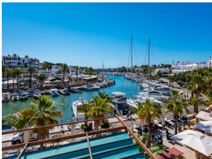
El puerto de Cala d'Or