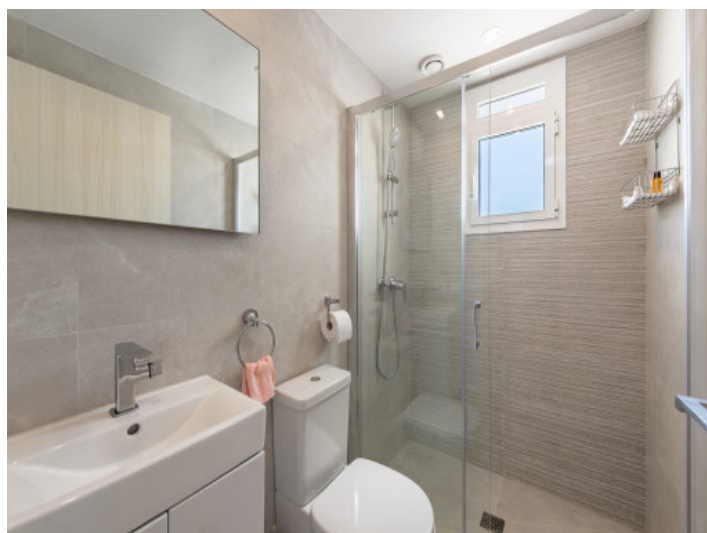
Uno de 2 baños