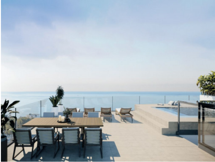
Azotea y piscina