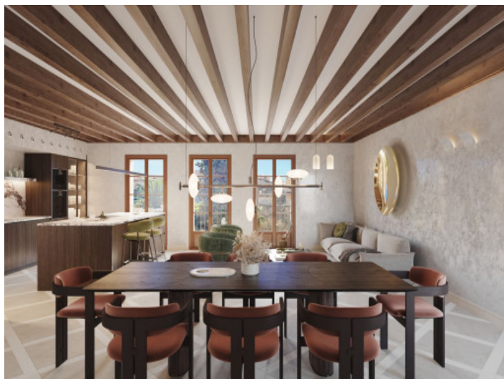
Salón-comedor y cocina