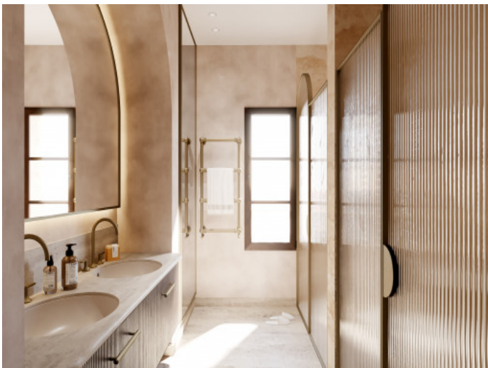
Baño en suite