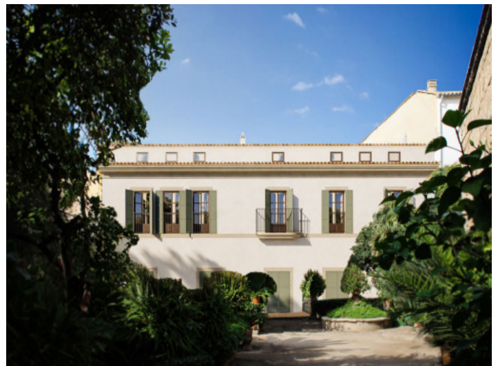
Vista al edificio

Toda la información como mejor se puede saber, salvo por error durante el periodo de venta. Sirva este documento como un informe previo, las bases legales solo serán válidas a través de un contrato de compra acordado ante Notario.