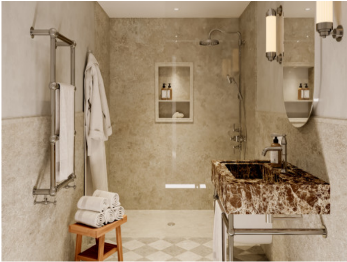
Baño con ducha