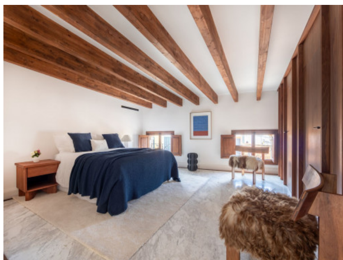
Uno de 3 dormitorios

Toda la información como mejor se puede saber, salvo por error durante el periodo de venta. Sirva este documento como un informe previo, las bases legales solo serán válidas a través de un contrato de compra acordado ante Notario.