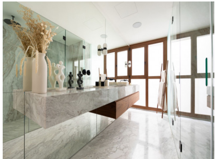
Baño en suite