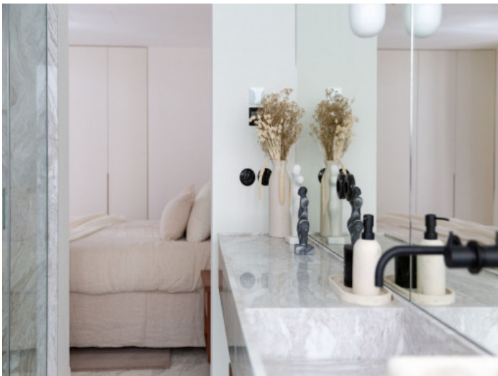
Baño en suite