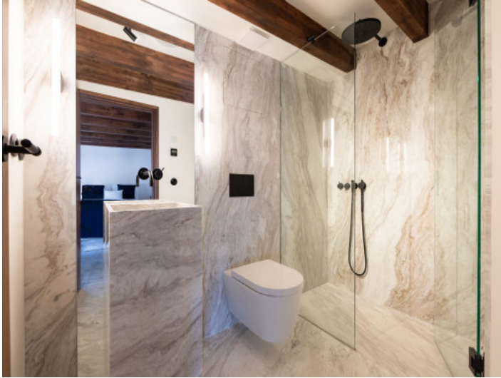
Baño en suite