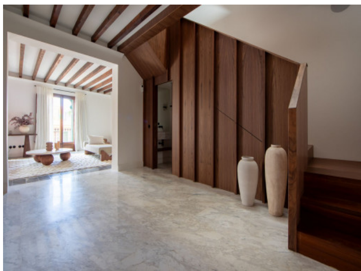
Pasillo y escaleras